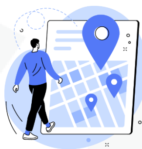
seus hábitos de deslocamento