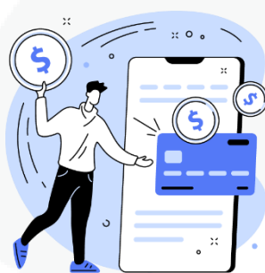
seus hábitos de consumo