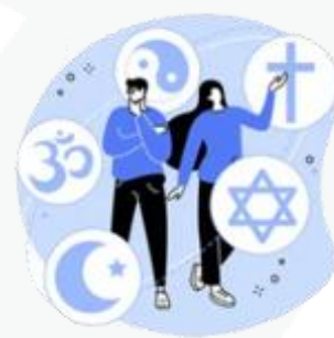
sua preferência religiosa

Agora fica fácil você compreender que o uso mal intencionado desses dados pode criar muitos problemas, como ocorre com os conhecidos golpes de boletos bancários, fraudes em contas de aplicativos, abertura indevida de contas bancárias e de consumo.